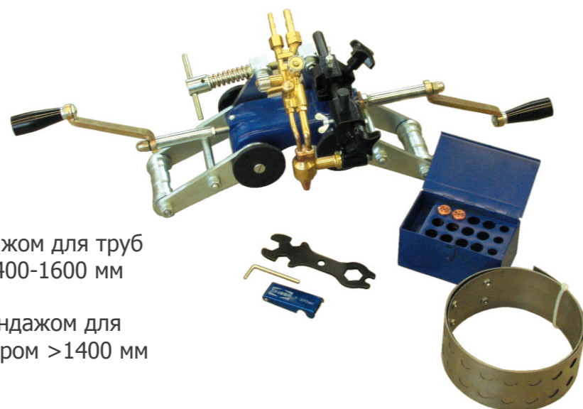
RSV-4 с банджом для труб с диаметром 400-1600 мм