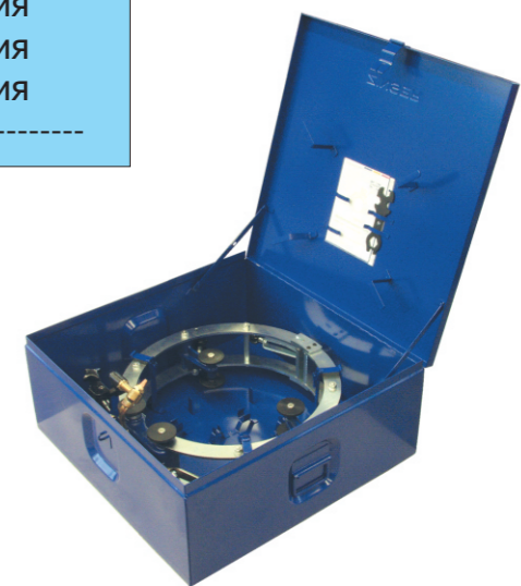
Accessory: Стальной ящик для хранения машин RSV и транспортировки

Ø 400 - 600 mm Ø 600 - 1000 mm Ø 800 - 1200 mm Ø 1200 - 1500 mm Ø 1400 - 1600 mm Ø 1500 - 1800 mm Ø 2000 - 2500 mm Ø 2500 - 3500 mm Ø 3500 - 4500 mm Ø 4500 - 6000 mm другие размеры по запросу