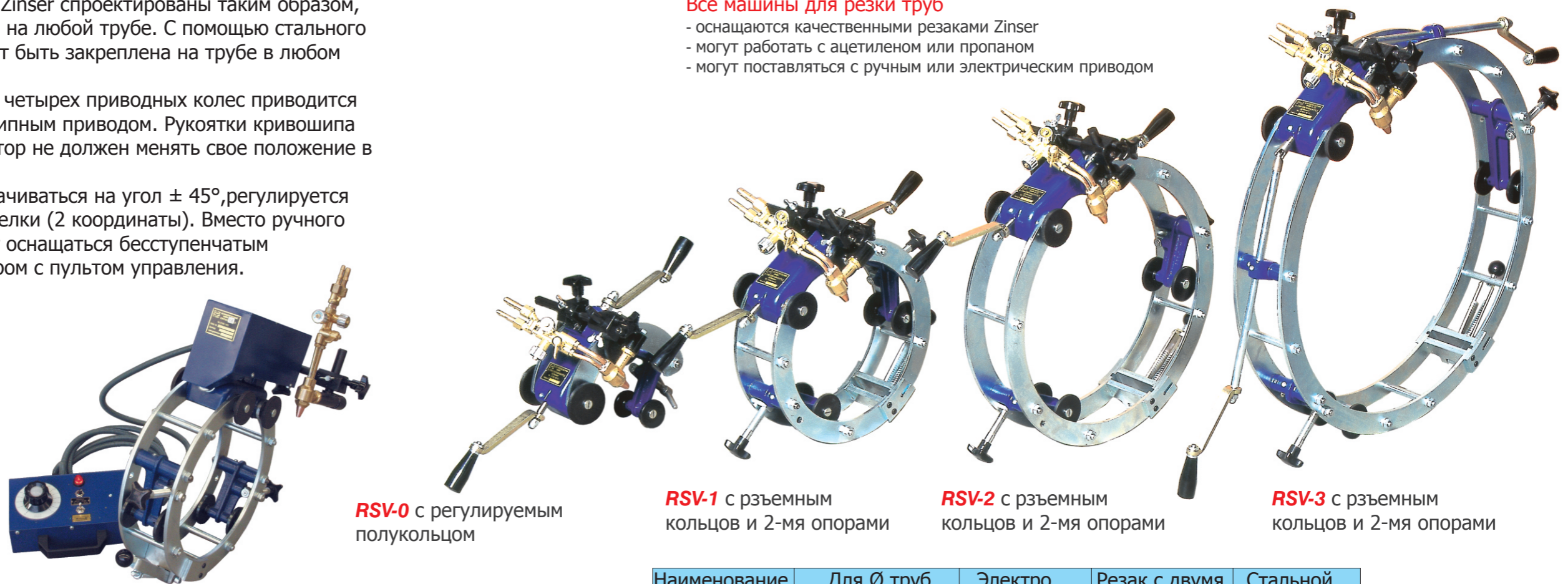
RSV-1 с электрическим приводом